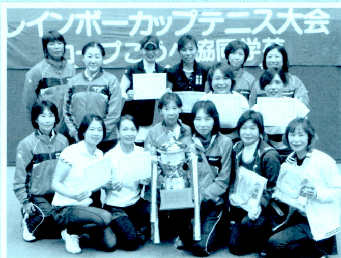
昨年度の団体優勝チーム〔兵庫県〕の皆さん