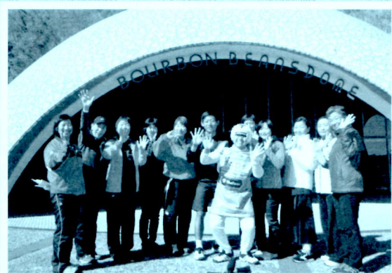
昨年度10府県代表の支部長・監督の皆さん