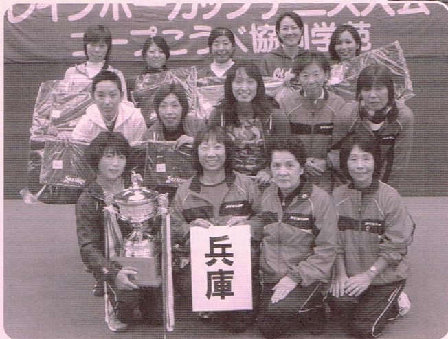
昨年度の団体優勝チーム〔兵庫県〕の皆さん